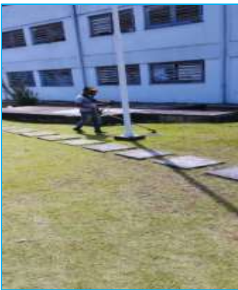
MANUTENÇÃO E CORTE DA GRAMA