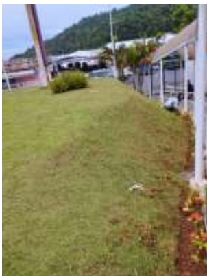
MANUTENÇÃO E CORTE DA GRAMA