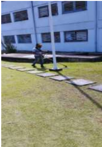
MANUTENÇÃO E CORTE DA GRAMA