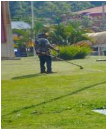
MANUTENÇÃO E CORTE DA GRAMA