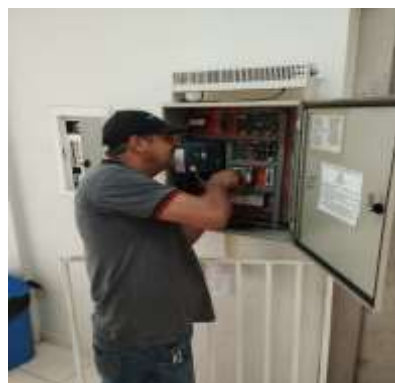
MANUTENÇÃO PREVENTIVA DO