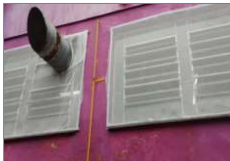
TROCA DAS TELAS DA COZINHA