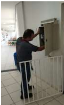
MANUTENÇÃO PREVENTIVA DO ELEVADOR