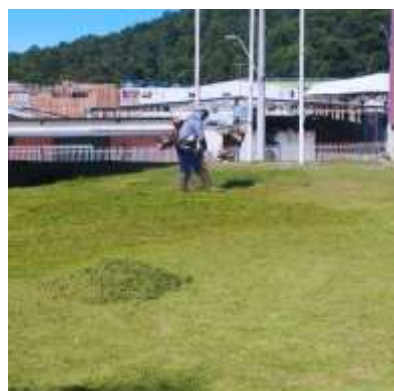
MANUTENÇÃO E CORTE DA GRAMA