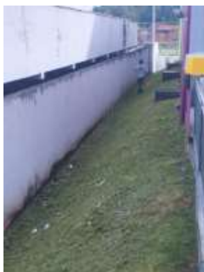
MANUTENÇÃO E CORTE DA GRAMA