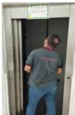
MANUTENÇÃO PREVENTIVA DO ELEVADOR