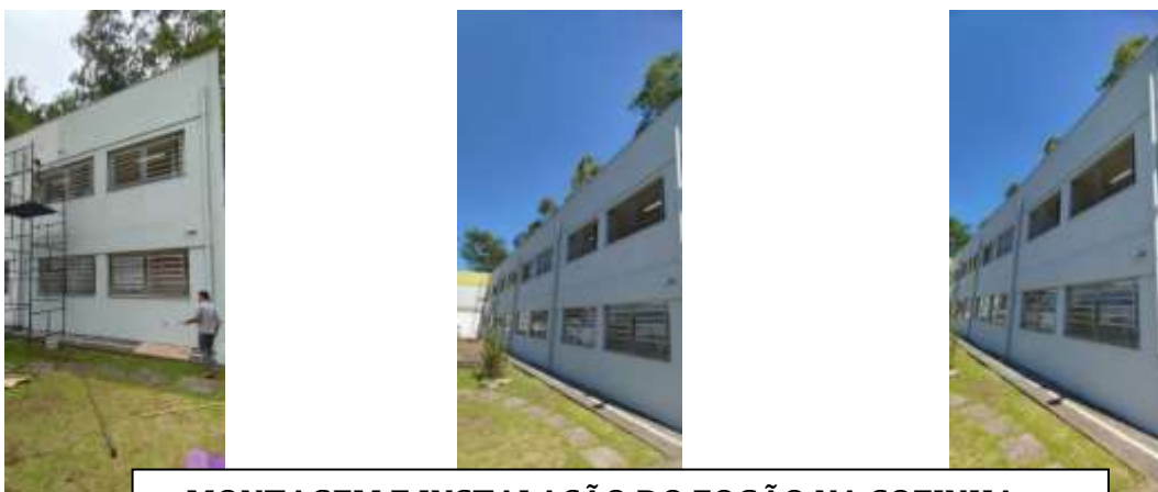
MONTAGEM E INSTALAÇÃO DO FOGÃO NA COZINHA