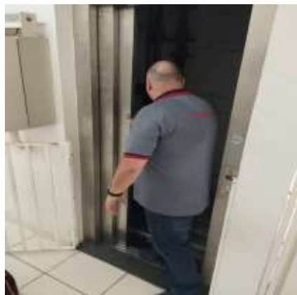
MANUTENÇÃO PREVENTIVA DO ELEVADOR